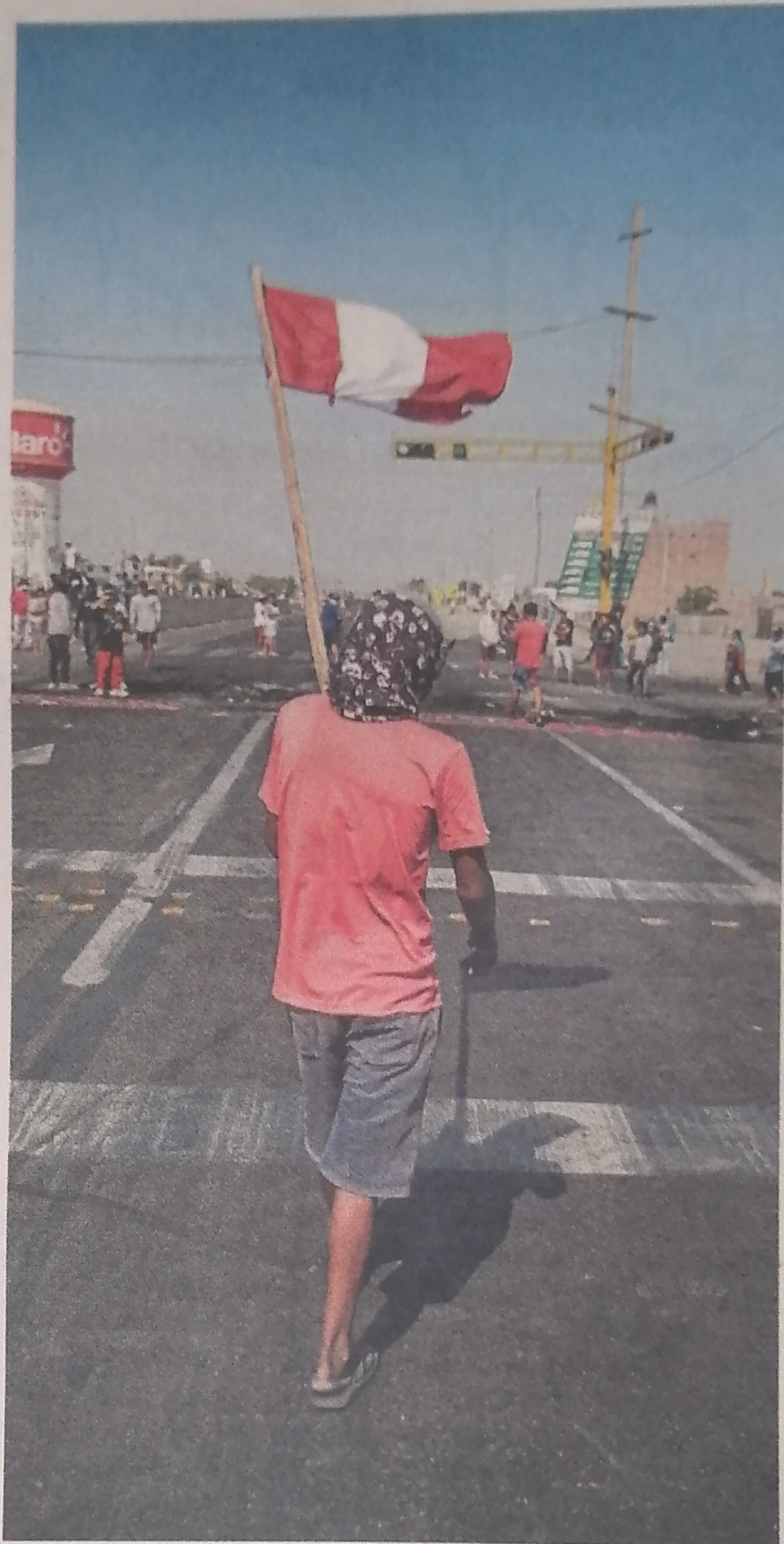
Un manifestante bloquea una calle en Perú.

Otro de sus principales apoyos durante la última vuelta electoral, la política Verónica Mendoza, líder de la coalición progresista Juntos por Perú, declaró en Twitter que “el Gobierno no solo ha traicionado sus promesas de cambio, sino que ahora repite el método de ‘resolución de conflictos’ de la derecha”